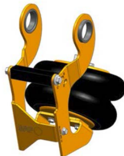
Dvoustranné zvedání 03 027 1278 01

Lze využít několik opěrných poloh ramene. Přiřazení konstrukční řady (kombinace kozlíku pérování, nástavce nad vlnovcem pérování a vlnovce pérování) k opěrné poloze ramene najdete v návodu k montáži a v konstrukční příručce http://designmanual.safholland.de .